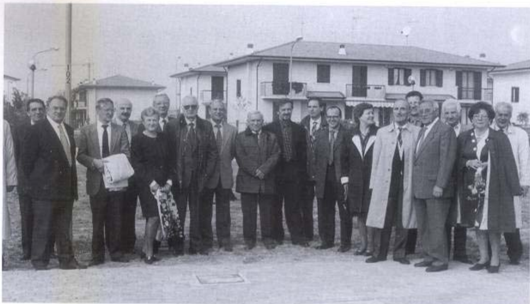
Dirigenti, tecnici e collaboratori della Famiglia presenti alla cerimonia