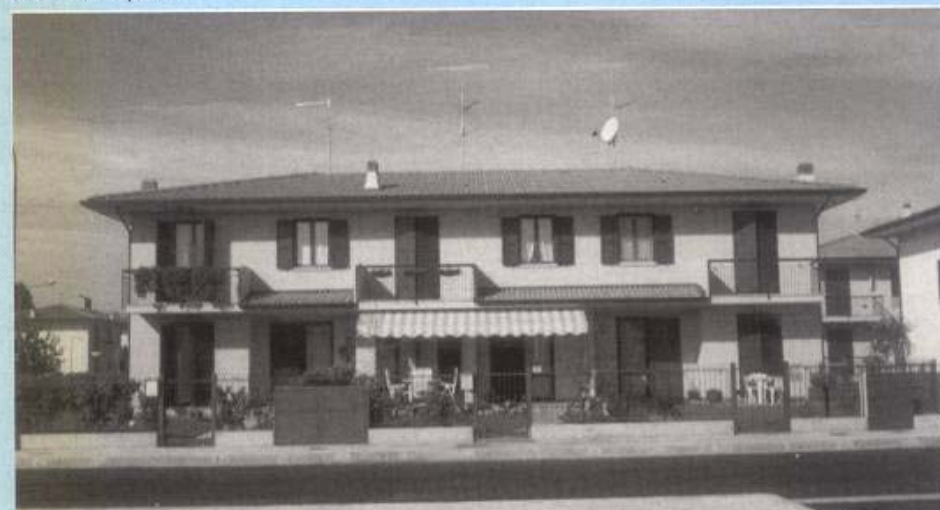
Casa a schiera tipo "E 3"