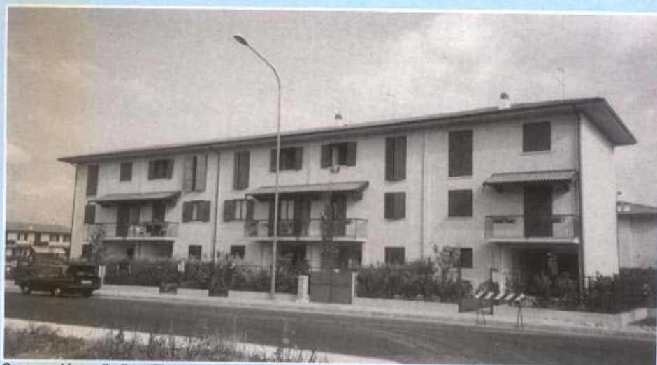
Casa a schiera alta tipo "Z"