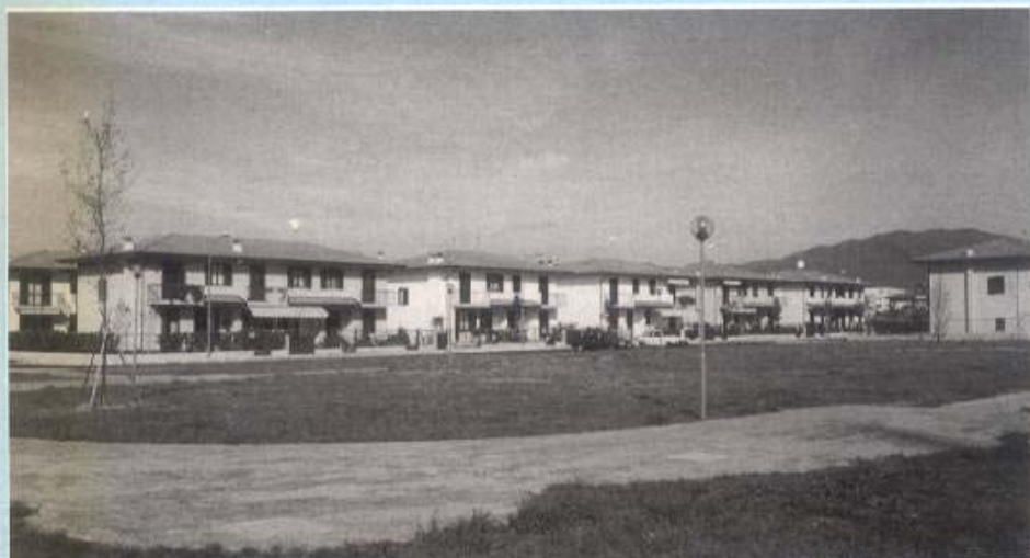
Panoramica con la zona a verde centrale