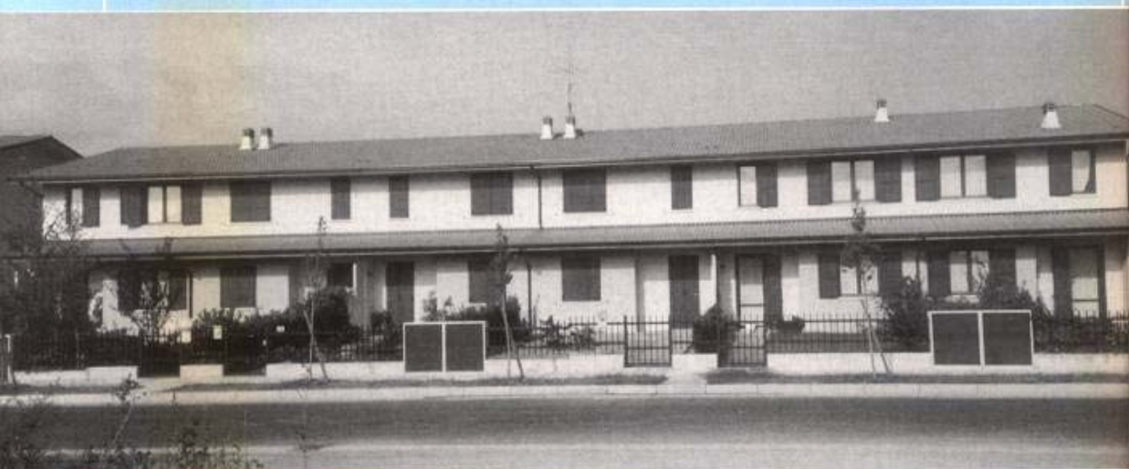
Casa a schiera tipo "C.S."

Violino, con le nuove realizzazioni il villaggio si è ulteriormente ingrandito