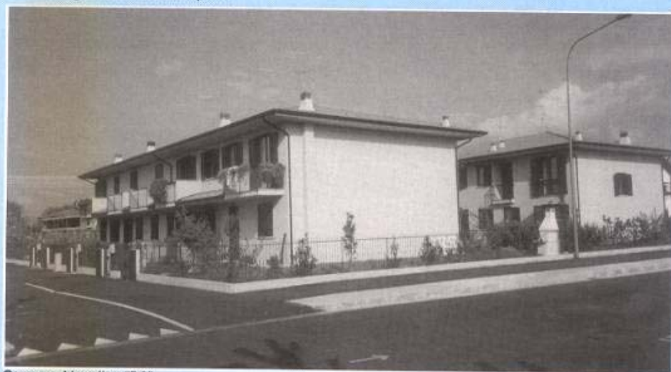
Casa a schiera tipo "E 3"