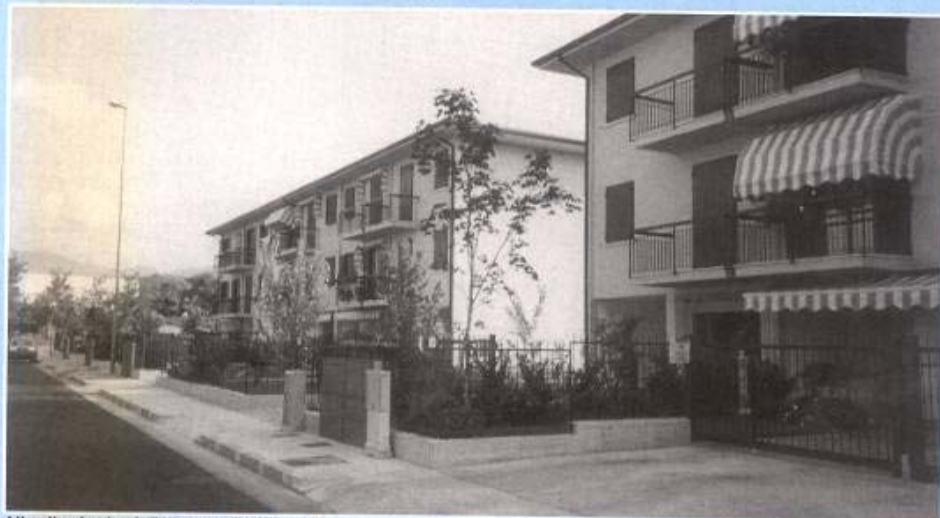
Altra tipologia della casa alta tipo "S"