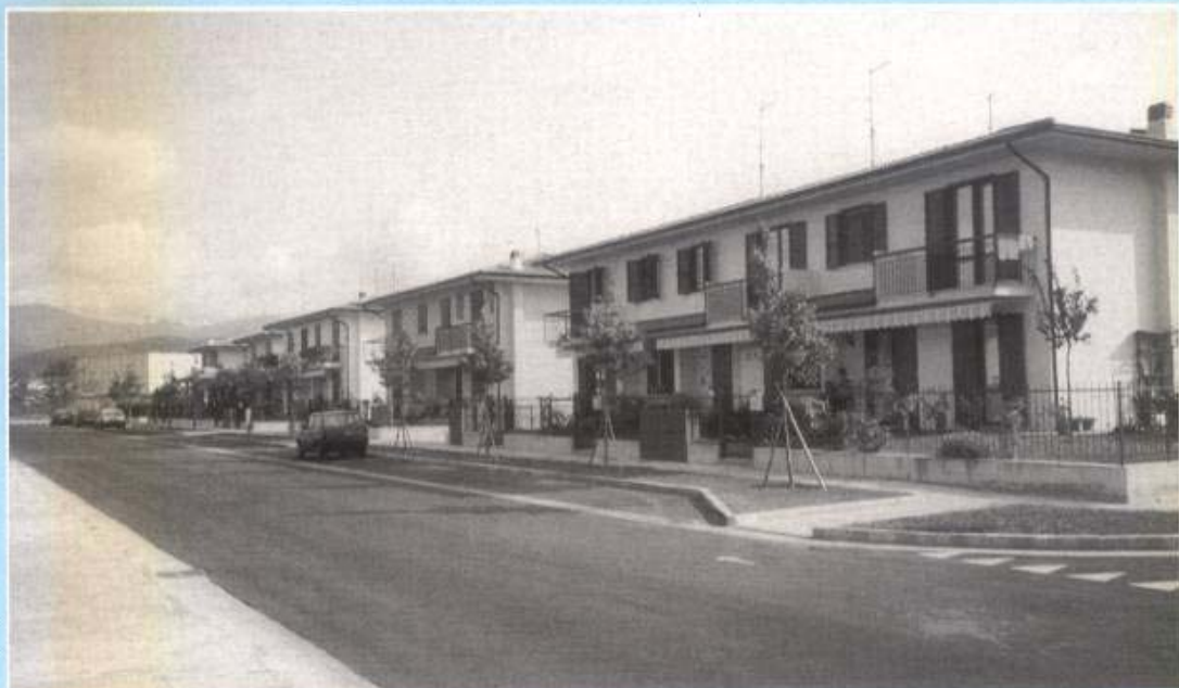
Panoramica della via Re Desiderio

Violino, con le nuove realizzazioni il villaggio si è ulteriormente ingrandito