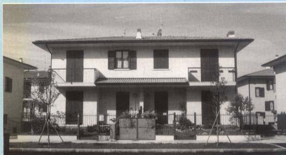
Casa binata tipo "E"