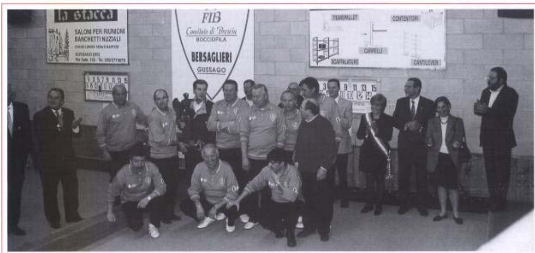
La boccefila con i dirigenti e amici frequentanti il centro.