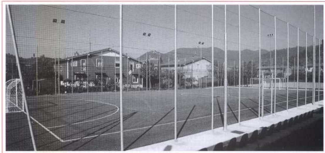
Il campo di calcio; sotto, veduta esterna del bocciodromo.