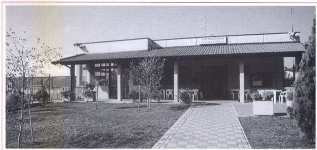
L'ingresso del centro sociale "G. Marcolini"