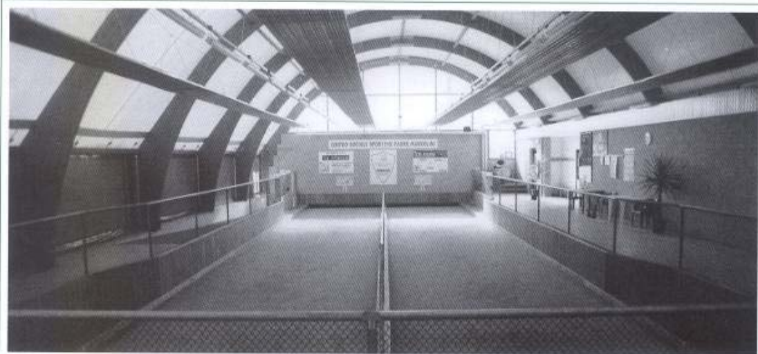
L'interno ampio e luminoso del bocciodromò gussaghese; sotto, l'area giochi in un villaggio.