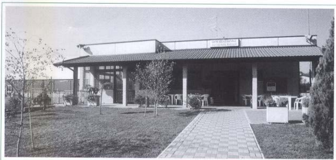
L'ingresso del centro sociale "O. Marcolini" a Gussago.