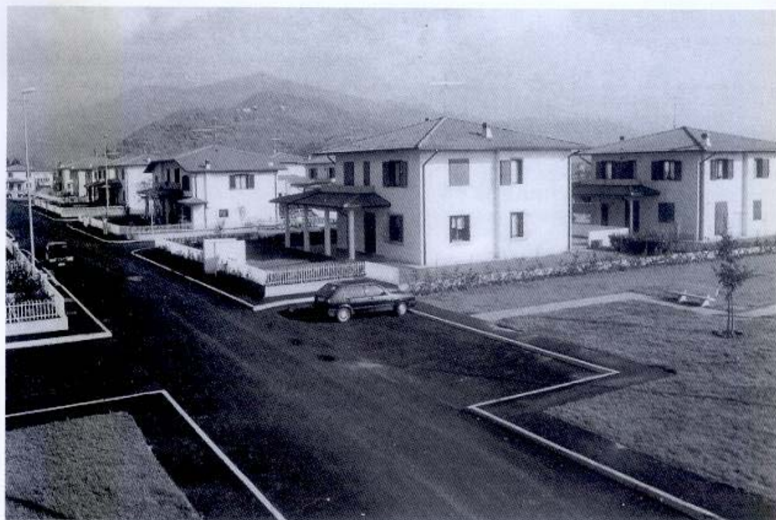
In questa pagina e nelle seguenti, recenti realizzazioni della Famiglia con ampi spazi e verde secondo i nuovi standard urbanistici.

da chi vi fu «deportato» (sic!) ed ora in particolare grave stato di abbandono.