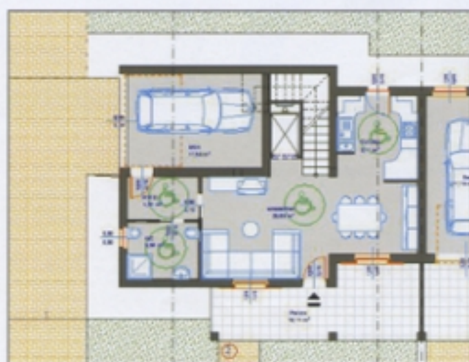
PIANTA PIANO TERRA TIPOLOGIA A2