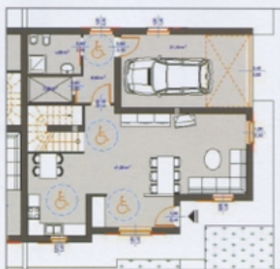
PIANTA PIANO TERRA TIPOLOGIA B4