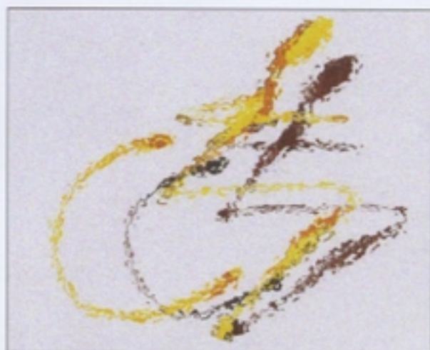
Idea per logo disabili

Svolgendo un lavoro di questo tipo ci siamo trovati decisamente allo sbaraglio e, in un certo senso disorientati perché la materia da trattare risultava molto varia ed articolata. Dai due progetti da noi e-