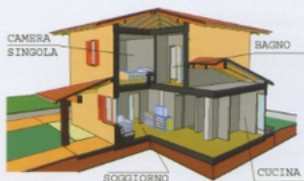
SPACCATO TIPOLOGIA A2

Grazie a questa nuova proposta ci siamo confrontati con le problematiche inerenti il mondo del lavoro, abbiamo potuto conoscere le difficoltà che le persone disabili affrontano quotidianamente ed abbiamo collaborato alla continuazione del lavoro di Padre Marcolini che con passione viene svolto ogni giorno presso l'ufficio tecnico.