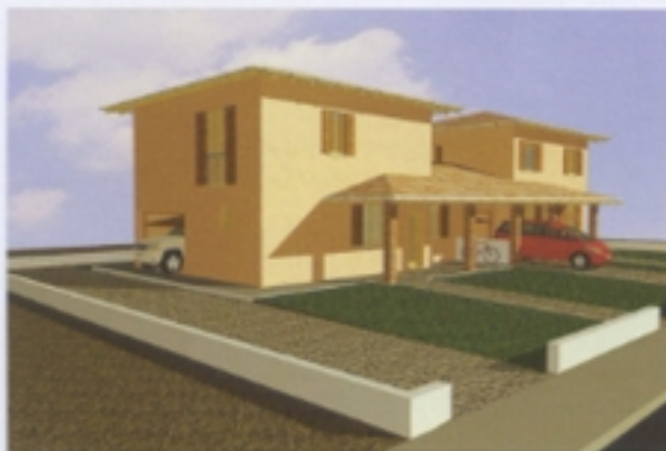
Villetta bifamiliare denominata B2

laborati tuttavia, sono sorte alcune idee apprezzate dallo staff della cooperativa che potrebbero essere considerate per le prossime progettazioni marcoliniane.